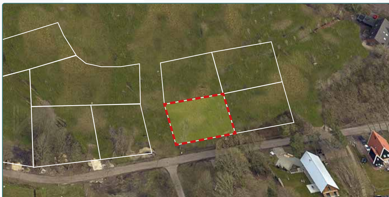
Kavel 158 vanuit de lucht